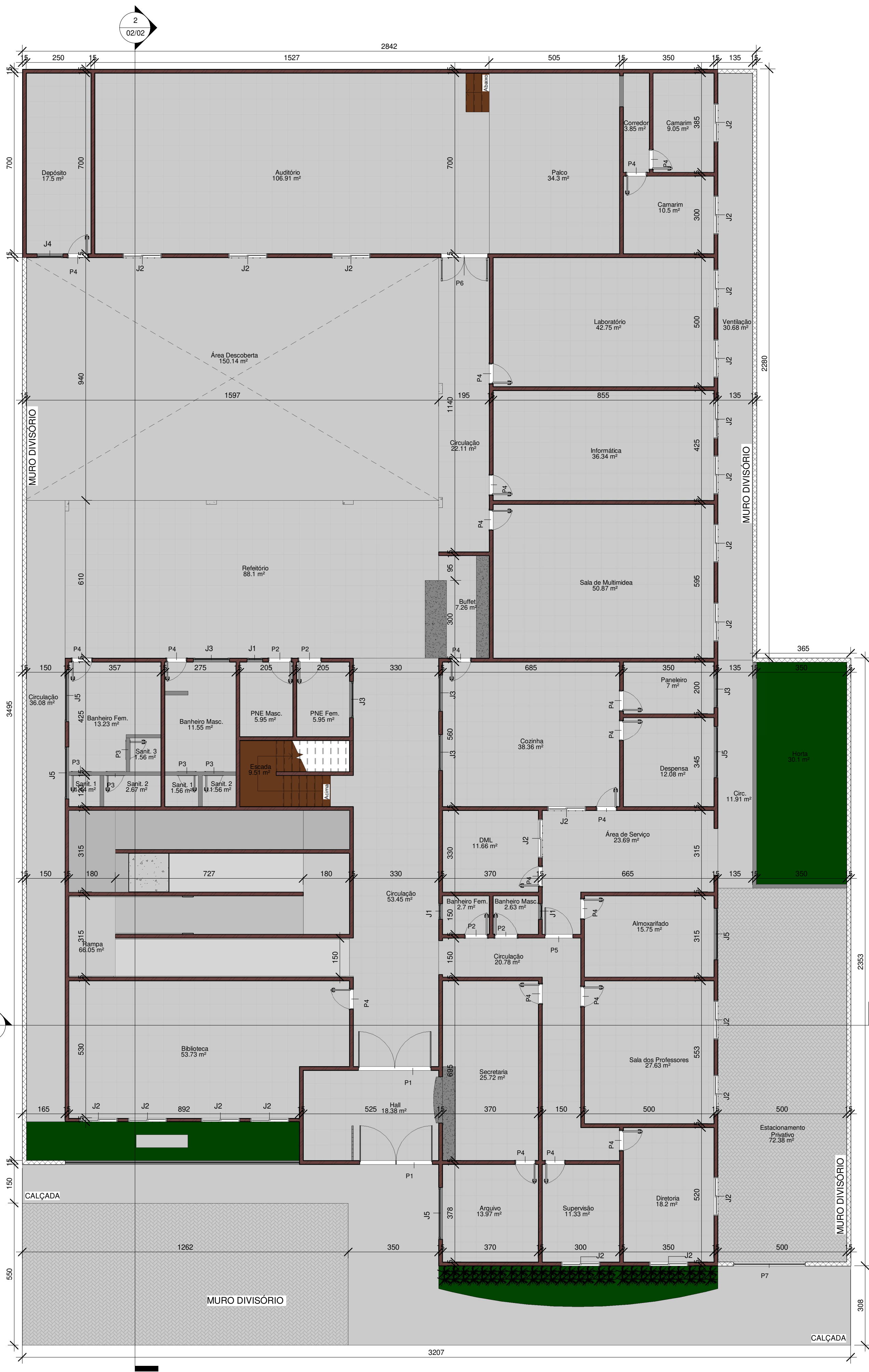
1 Planta Baixa 01 1 : 100